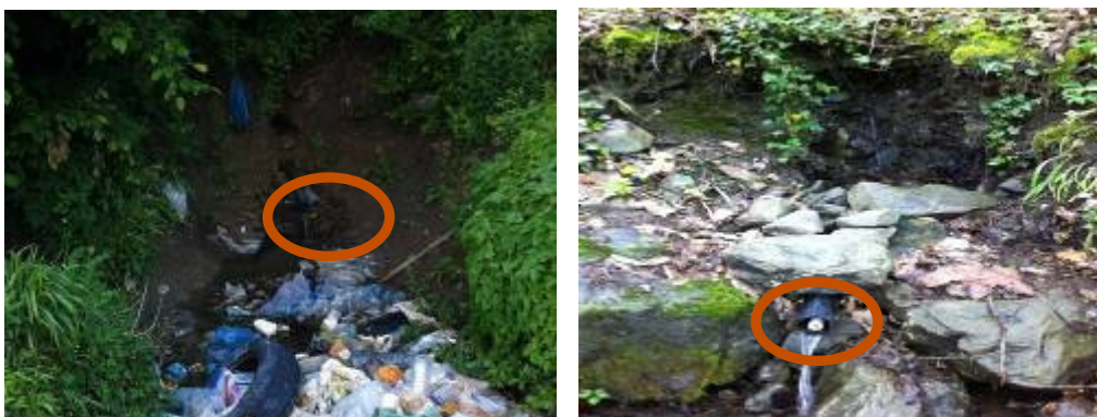
Foto: Izvori vode na spornom lokalitetu, 3. jun 2011

Na lokaciji Vasove vode, opština Berane nalazi se neuređeno odlagalište otpada koje nema nikakvih dozvola niti zadovoljava zakonske uslove da bude privremeno rješenje do izgradnje regionalne sanitarne deponije. Na ovom smetlištu odlagan je sem čvrstog komunalnog i elektro, životinjski, veterinarski i medicinski otpad, što je uzrok da kompletna količina odložena na Vasovoj vodi predstavlja u suštini deponiju opasnog otpada. Zbog blizine rijeke Lim, naseljenih porodičnih objekata i obradivog zemljišta, kao i sakralnih objekata Šudikova i Đurđevi stupovi, ovo nelegalno smetlište neosporno predstavlja opasnost po zdravlje ljudi i životnu sredinu, što je obzirom na povećanje temperature u toku ljetnjeg perioda još izraženiji problem. Prije svega prijeti opasnost od pojave zaraznih infekcija, povećanja oboljenja respiratornih organa i kancerogenih bolesti, odnosno zagađenja vazduha površinskih i podzemnih voda zemljišta, što prouzrokuje i oboljenja stoke i poljoprivrednih proizvoda. Obzirom da se mještani bave poljoprivrednom proizvodnjom i prodajom, zagađenost vazduha, zemljišta i vode može imati negativan uticaj na zdravlje značajnog broja građana koji učestvuju u tom lancu.