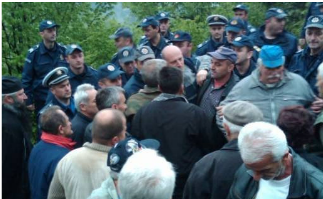
Foto: Detalj sa poslednjeg razbijanja mirnih građanskih protesta, maj 2011

Peticija koju je potpisalo 3.119 punoljetnih građana Berana, prati Ustav i važeće zakone, pa imamo situaciju da se upravo zainteresovana javnost bori za njihovo poštovanje, što bi trebalo da bude više nego dovoljan signal Vladi da zaštiti javni interes. Apsurdno je što se nakon izgubljene 4 godine, u kojima su sem vremena utrošena i značajna finansijska sredstva, nastavlja sa prolongiranjem priznanja da su učinjeni propusti.