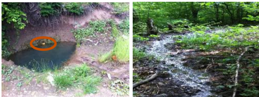
Izvori na Vasovim vodam, 3. jun 2011

procjene uticaja regionalne sanitarne deponije u opštini Berane na životnu sredinu koja bi bila u nadležnosti Agencije za zaštitu životne sredine.